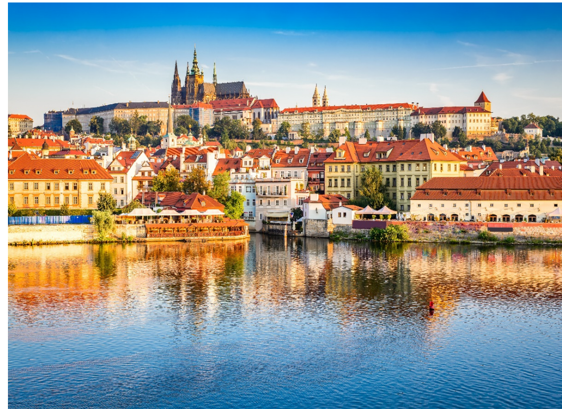
Prag: Eine Perle am Wasser

Für Menschen mit Mobilitätseinschränkungen: Aus unserer Sicht für Menschen mit eingeschränkter Mobilität nur bedingt geeignet.