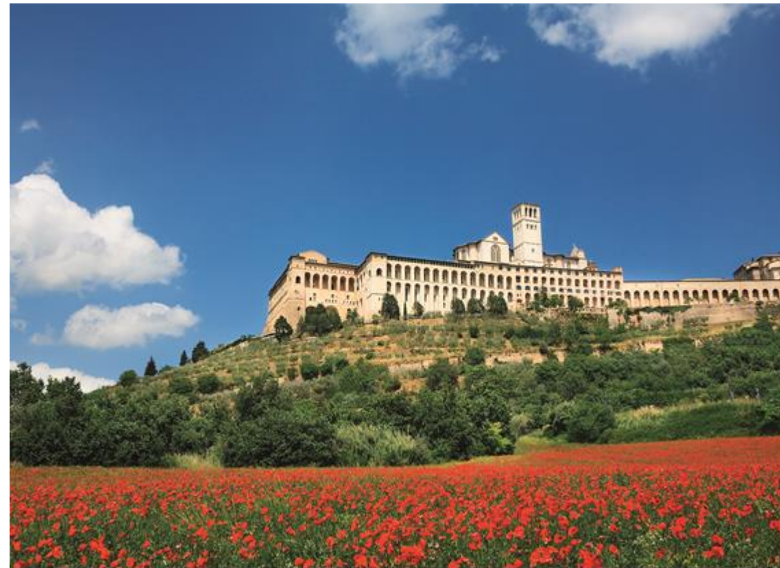
Sacro Convento San Francesco, Assisi

Die beigefügten Allgemeinen Reisebedingungen sind Bestandteil dieses Prospektes. Regelungen zum Rücktritt vor Reiseantritt: siehe Ziffern 6 & 7 (Stornobedingungen Ziffer 7.1)